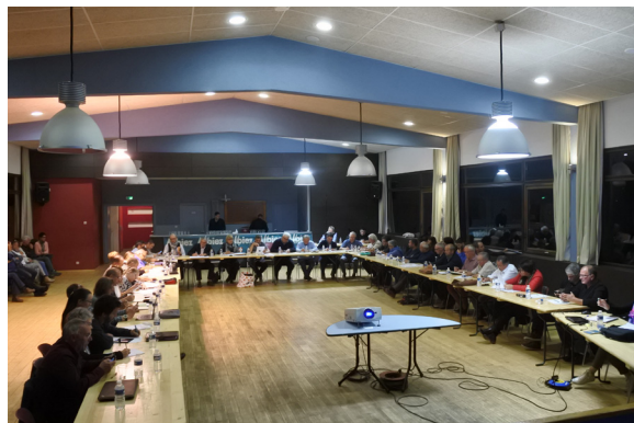
Le conseil communautaire au travail