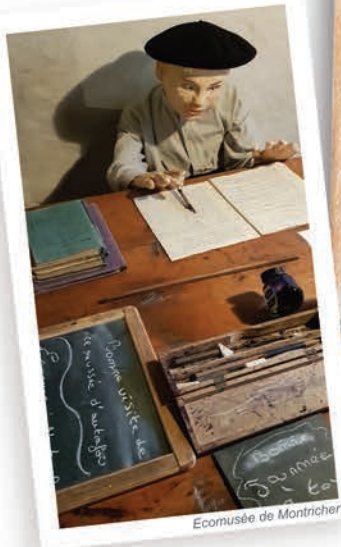
Ecomusée de Montricher