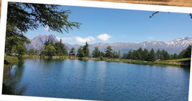
Le Lac de Pramol et la Croix des Têtes