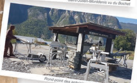
Rond-point des ardoisiers à Saint-Julien-Montdenis