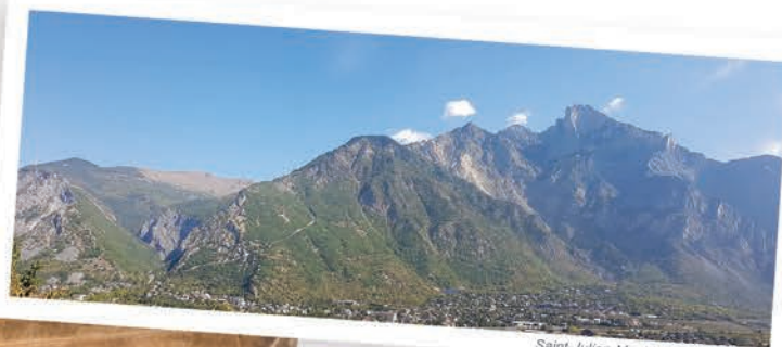
Saint-Julien-Montdenis vu du Bochet