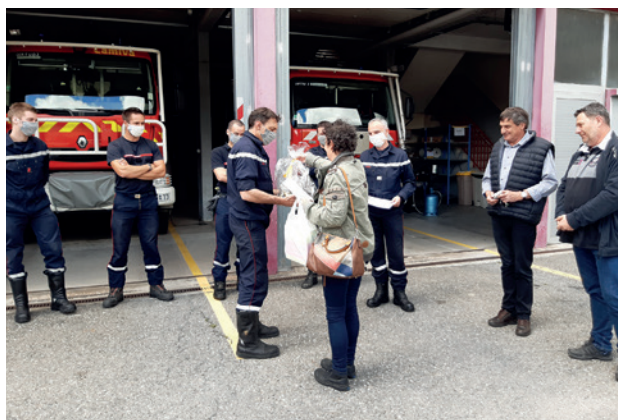
Visite aux pompiers