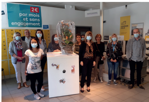
Visite au personnel de l'agence postale