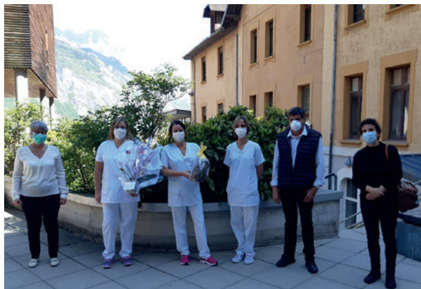
Visite au personnel de l'EHPAD

La 3CMA et le GAEM tiennent à remercier sincèrement tous les généreux donateurs !