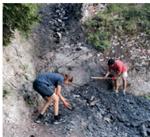
Chantiers Jeunes Sentier des Ardoisiers