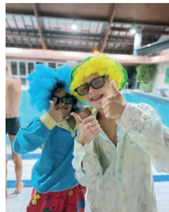
Soirée de l'Espace Jeunes au Centre Nautique