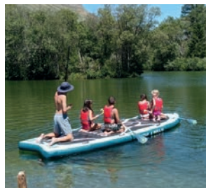
Activité Paddle Accueil de loisirs du Carrousel