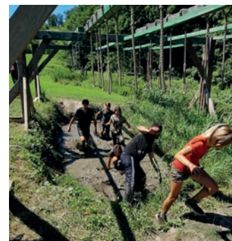
L'Espace Jeunes participe à la « Barjo Xtrem » à Vernaison