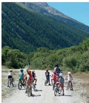
Sortie VTT à Bessans Accueil de loisirs du Carrousel