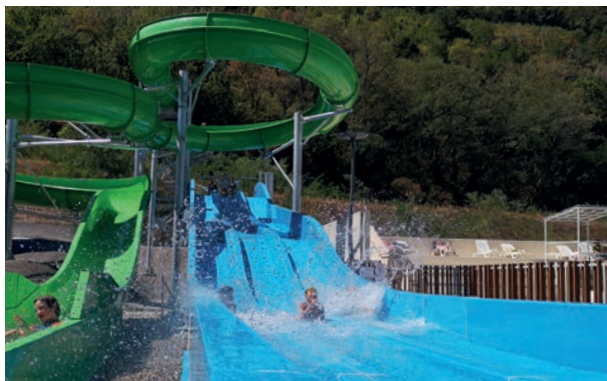
Nouvel Espace Aqualudique au Centre Nautique