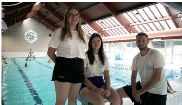
Les emplois jeunes de l'été au Centre Nautique