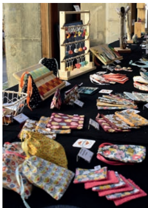
Le Patio des Arts Exposition - vente